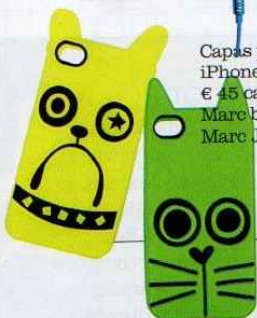
Capas para iPhone, € 45 cada, Marc by Marc Jacobs.