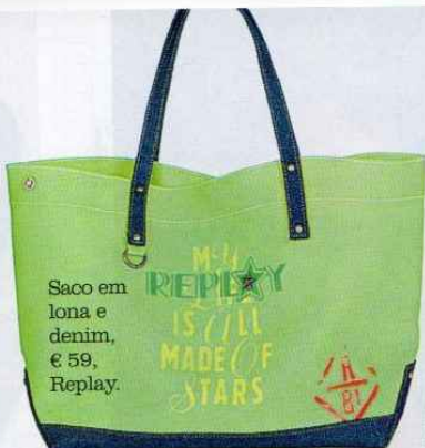
Saco em lona e denim, € 59, Replay.