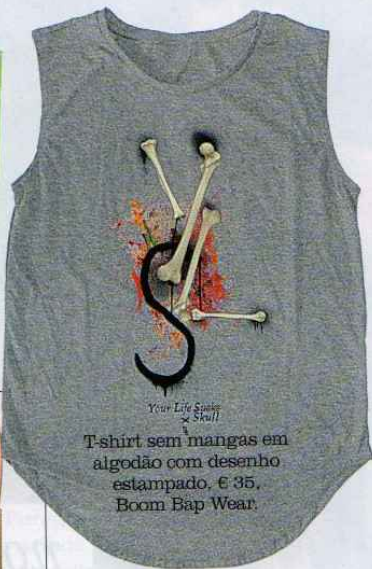
T-shirt sem mangas em algodão com desenho estampado, € 35, Boom Bap Wear.