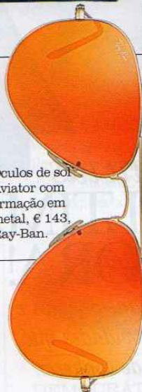
Óculos de sol Aviator com armação em metal, € 143, Ray-Ban.