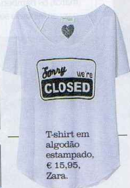
T-shirt em algodão estampado, € 15,95, Zara.