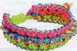
Pulseira em metal e fios de algodão, € 6,95, Essentials no El Corte Inglés.