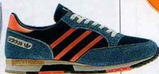
Tênis em nylon e camurça, € 110, Adidas.