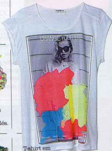
T-shirt em algodão com motivo estampado, € 15,95, Zara.