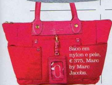
Saco em nylon e pele, € 375, Marc by Marc Jacobs.