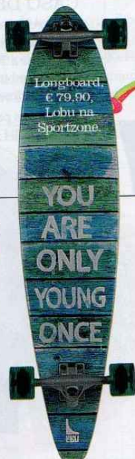
Longboard, € 79,90, Lobo na Sportzone.