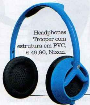
Headphones Trooper com estrutura em PVC, € 49,90, Nixon.