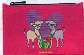
Bolsa em tela estampada, € 22, Bimba & Lola.