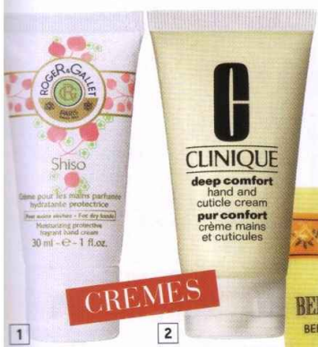
1. Creme de mãos Shiso, € 5,02, Roger & Gallet. 2. Deep Comfort, para mãos e cutículas, € 21, Clinique. 3. Creme de mãos com chá de bergamota, € 14,50, L'Occitane. 4. Precision, Body Excellence, creme nutritivo e rejuvenescedor, € 46, Chanel.