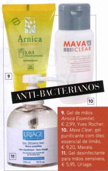
9. Gel de mãos Arnica Essentiel, € 2,99, Yves Rocher. 10. Mavala Clear, gel purificante com óleo essencial de limão, € 9,20, Mavala. 11. Gel desinfetante para mãos sensíveis, € 5,95, Uriage.