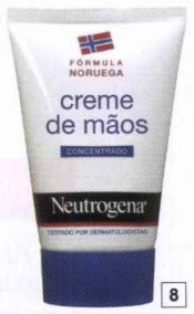
5. Creme reconstrutivo e reparador, € 10,50, Nails 4 Us. 6. Ultimate Strength Hand Salve, com parte da venda a reverter para caridade, € 17, Kiehl's. 7. Lipidose, para mãos gretadas, € 8,11, Vichy. 8. Creme de mãos concentrado, € 8,29, Neutrogena.